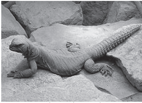
לטאה בפעלת זנב קוצני

לְטָאוֹת אַחֲרוֹת מְשֵׁת־מִשׁוֹת בְּזָנֵב כְּמוֹ בְּכָלִי לְחִימָה. לְלְטָאוֹת הָאֵלֶּה יֵשׁ זָנֵב קוֹצָנִי. כַּאֲשֶׁר לְטָאָה כְּזֹאת מוֹתֶקֶפֶת אוֹ נִתְפָּסֶת עַל יָדֵי בַּעַל חַיִּים אוֹיֵב, הִיא מְכָה בּוֹ בְּזָנְבָהּ, וְהַמְּכּוֹת מְכַאִיבוֹת מְאֹד.