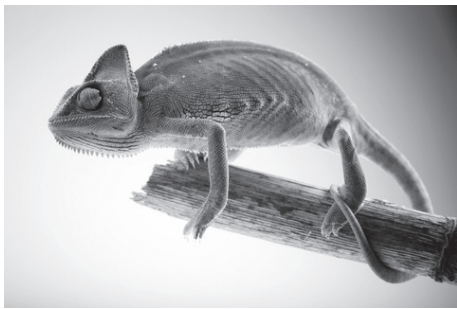
זיקית על ענף

למה לבעלי חיים רבים יש זנב? בשביל מה צריך זנב? בעלי חיים רבים משתמשים בזנב שלהם לתנועה. קופים הקופצים מעץ לעץ משתמשים בזנבם כדי לכוון את קפיצתם, ממש כמו נהג המשתמש בהגה כדי לכוון את המכונית. גם הזנב של הציפורים משמש להן כמו הגה בזמן שהן עפות.