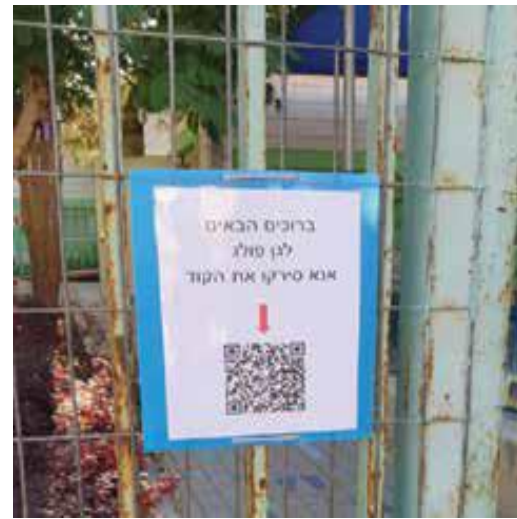
גן 'פולג', באר שבע / גנת: מיטל בנינו