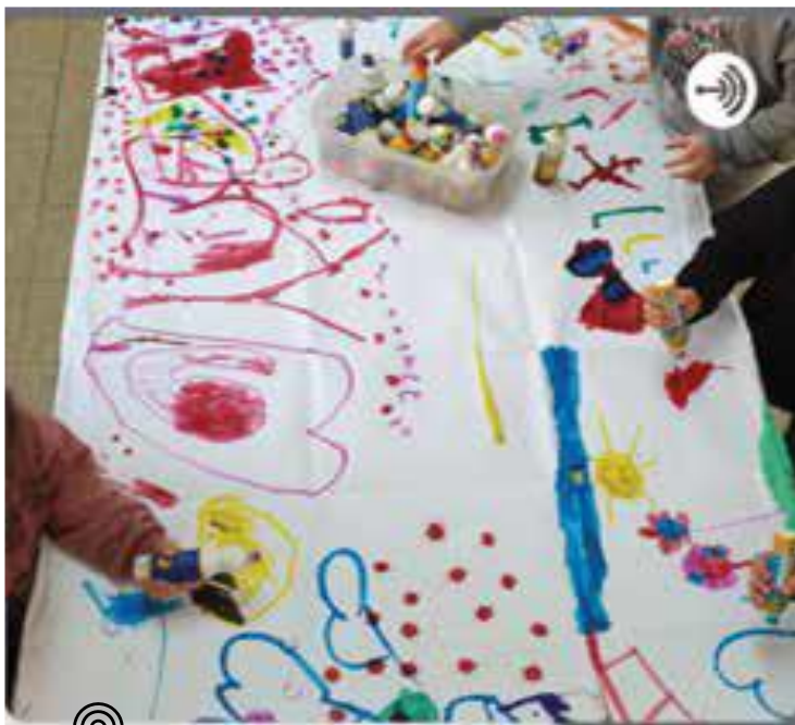
גני קיבוץ בקבוצת 'שילר' / גננת: כינרת און

"השימוש בפודקסטים בגן חושף ומגלה את עולמם הפנימי של הילדים, ופותח בפני ההורים פתח לחיי הגן כפי שהם באים לידי ביטוי בתקשורת בין ילדי הגן לגננת ולשאר הילדים. זהו מקום שבו אני, הגננת, מתווכת, מובילה, מחברת ומנתבת את השיח שמתהווה, והילדים מביאים את עצמם במלוא האותנטיות, באופן טבעי ומקבילים 'מקום' למחשבות שלהם ולרגשות שלהם, וזוכים גם לשמוע את עצמם מול ההורים בבית. באופן זה תהליך הקבלה והביטוי האישי שלהם מקבל חיזוק נוסף מול ההורים ובני המשפחה במעגלים נוספים. אני רואה את הפודקסט ככלי דיגיטלי חיובי ולעיתים אף טיפולי, ומשתמשת בו ככלי