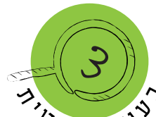
מושגים ונושאים מתמטיים