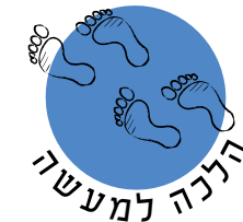
רעיונות לפעילויות וליישום חווייתי