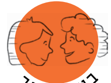
הצעות לעידוד השיח הרגשי והמתמטי

• ניתן להציע לילדים לאסוף 100 קוביות ולבנות מהן מבנה. רצוי לצלם את המבנה ולהציע אותו כדגם. כמו כן, לאפשר לילדים לבנות מבנים שונים עם אותו מספר קוביות.