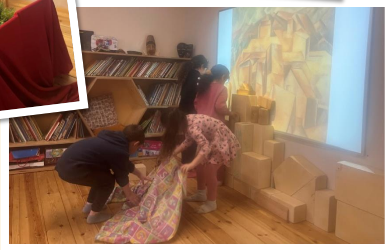
גן תדהר, הוד השרון