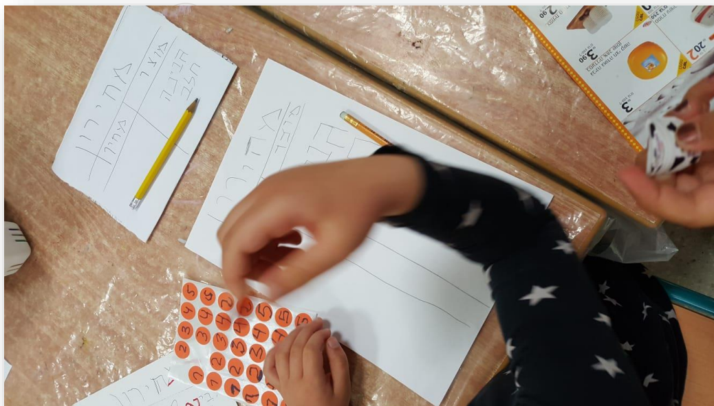
חפצי ברזל, גן כנרת, הרצליה