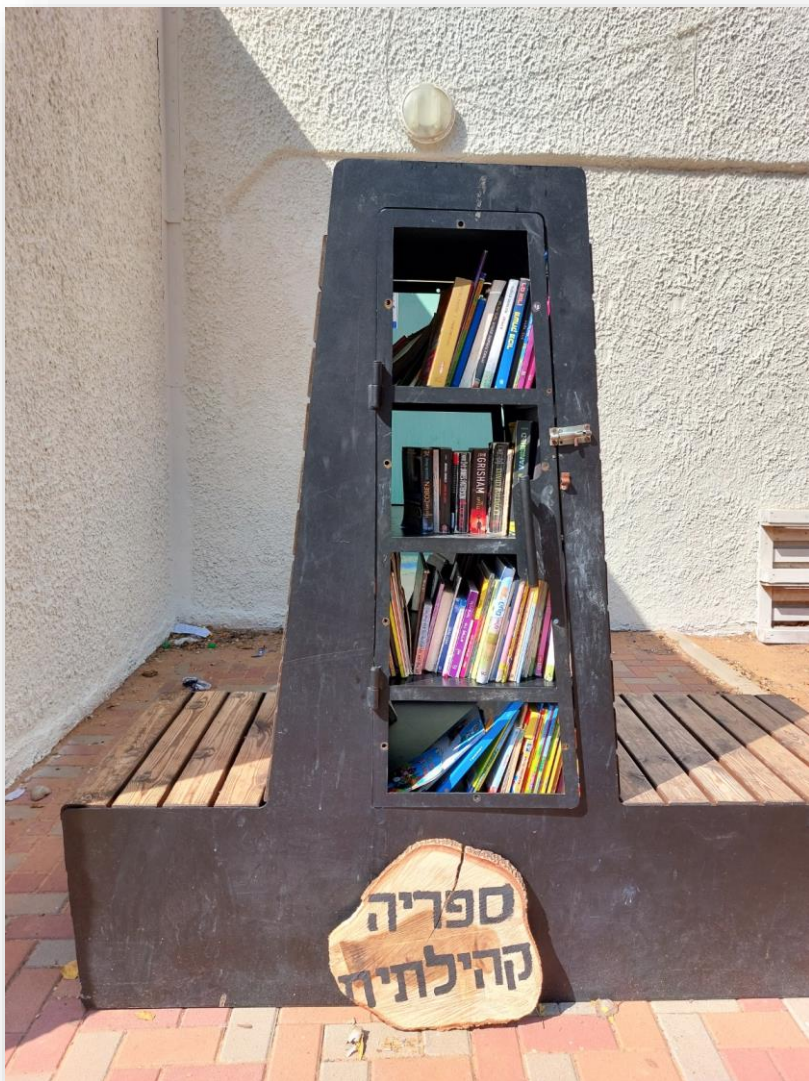
לירון ינקו, גן השיטה, נתניה