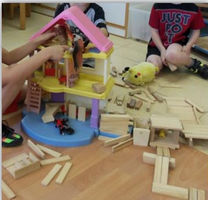
שילוב בין הקפלות, דמיות משחק קטנות לבית בובות