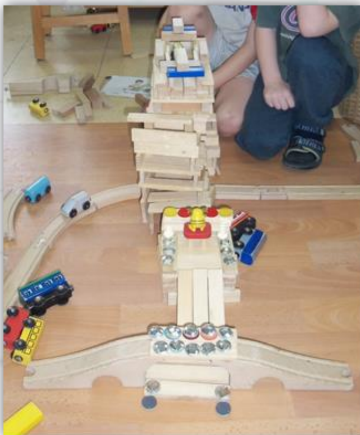
שילוב של הקפלות, מסילת רכבת וחפצים עגולים שנלקחו מהגלריה