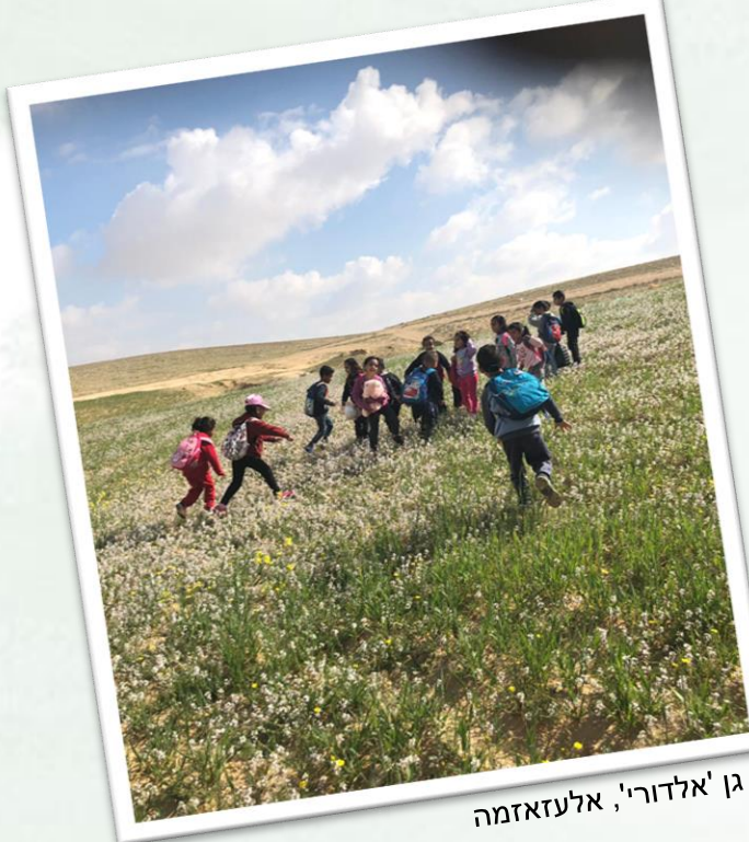
גן 'אלדורי', אלעזאזמה