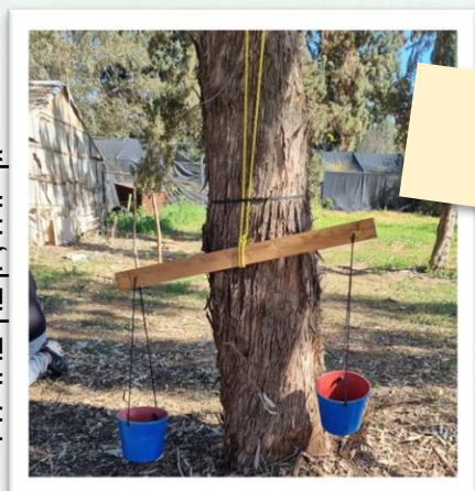
גן יורה, קיבוץ ברוך חיל

למשחק במרחבי הטבע ישנם מאפיינים ייחודיים. המרחב הפתוח ושלל האתגרים המוטוריים מעודדים את הילדים להשתמש בדמיון כדי להמציא חוקים חדשים ותרחישים שאינם קיימים במציאות, וכך הופך אותו למעניין ומאתגר יותר. מגוון עשיר של חומרי טבע מספק לילדים קרקע לביטוי עצמי. במרחב פתוח, בדרך כלל, אין הגבלה על עוצמת הקול ובזמן המשחק הילדים יכולים להביע את עצמם בצורה חופשית יותר כדי לתאר את החוויות שלהם. מאפיין נוסף של המשחק במרחבי הטבע הוא היותו משחק מבוסס ערכים סביבתיים. בזמן השהייה בטבע, הילדים נחשפים ליחסי גומלין בטבע ולצרכים של הסביבה הטבעית. במשחקים סוציו־דרמטיים ובמרחבי הטבע הילדים מעבדים את הידע הזה, כגון הכנת בתים לבעלי חיים, בניית תיבות האכלה לציפורים ועוד.