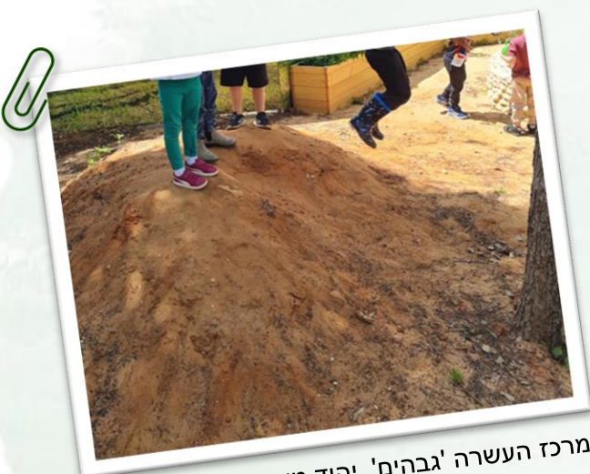
מרכז העשרה 'גבהים', יהוד מונסון