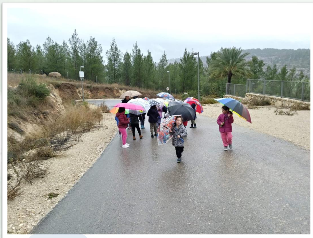
גן נרקיס, קיבוץ נתיב הל"ה