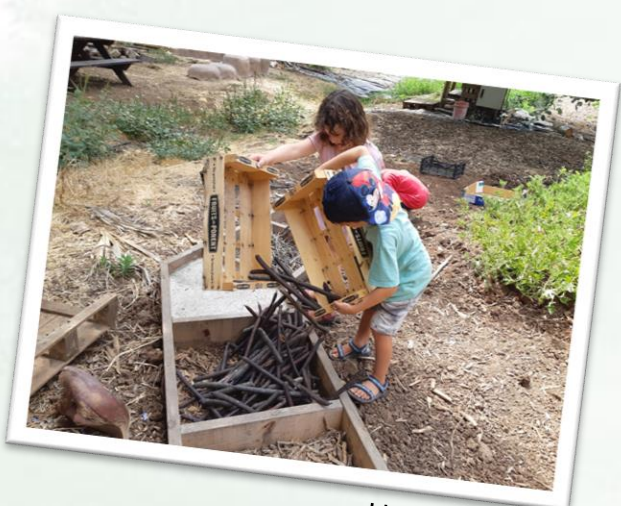
גן תמר, נהלל