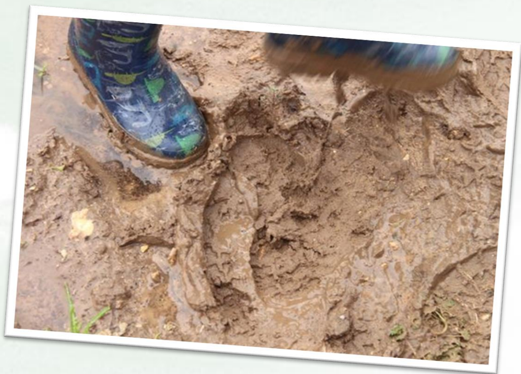
מרכז העשרה 'גן בחווה', רמת גן

ניתן לצפות בפעילות של ילדי גן 'צדף' בחוף הים, נהרייה.