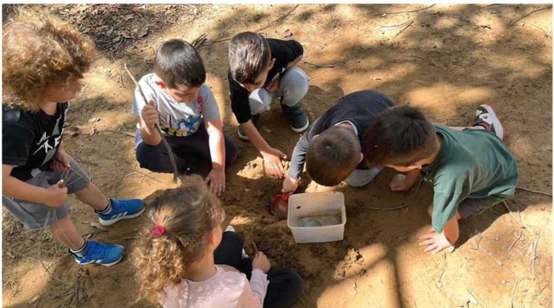
גן פז, נתניה