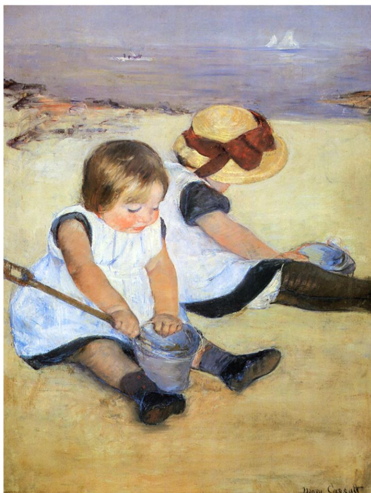
1884, Children Playing On The Beach, קסאט, 1884

ממני אלייך: עצות של גננות המקדמות למידה במרחבי הטבע