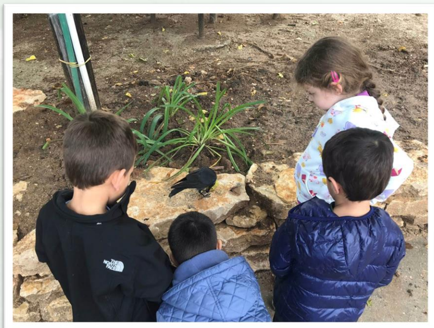
גן נרקיס, קיבוץ נתיב הל"ה