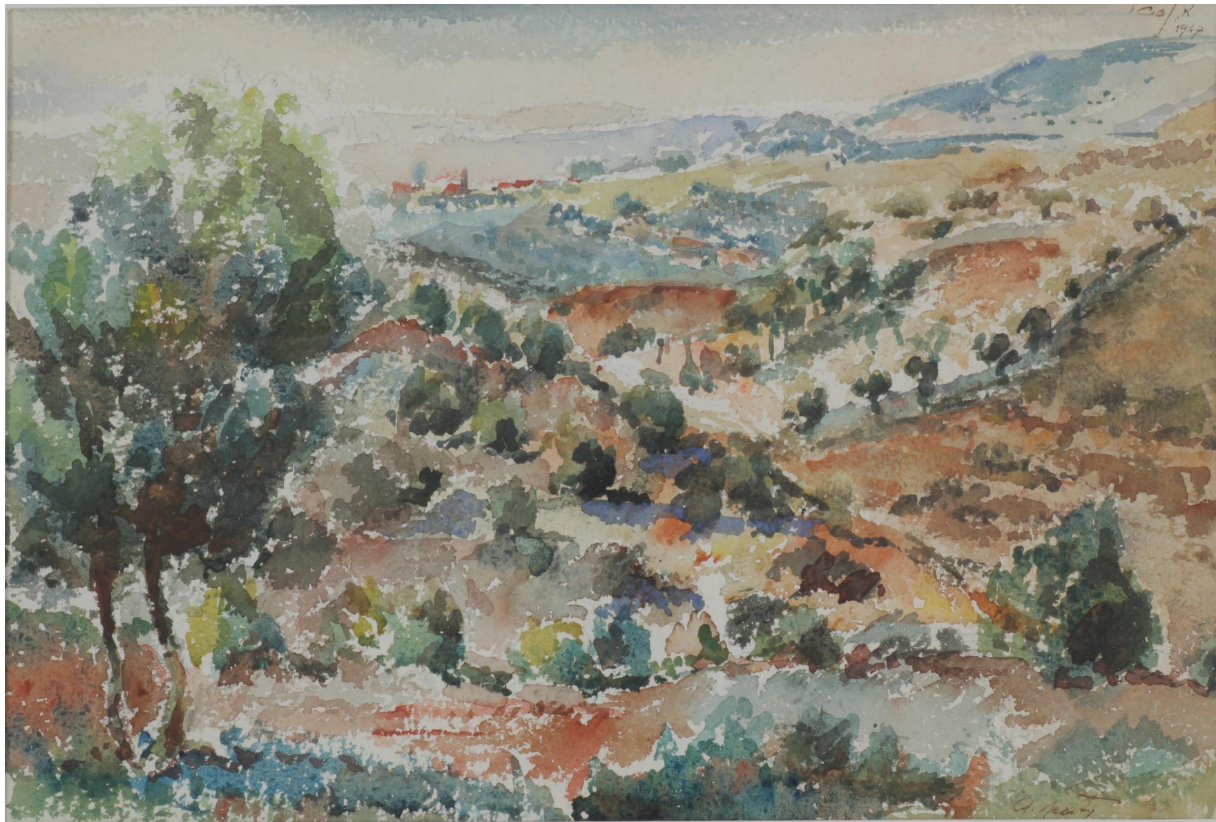
אברהם נסטי, נוף ישראלי, 1947, אקווראל על נייר