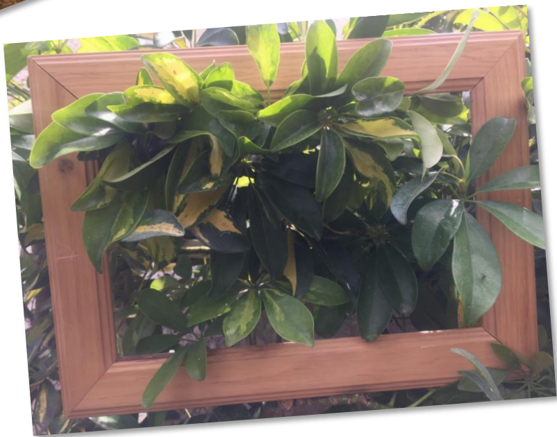
גוונים בנוף הקרוב