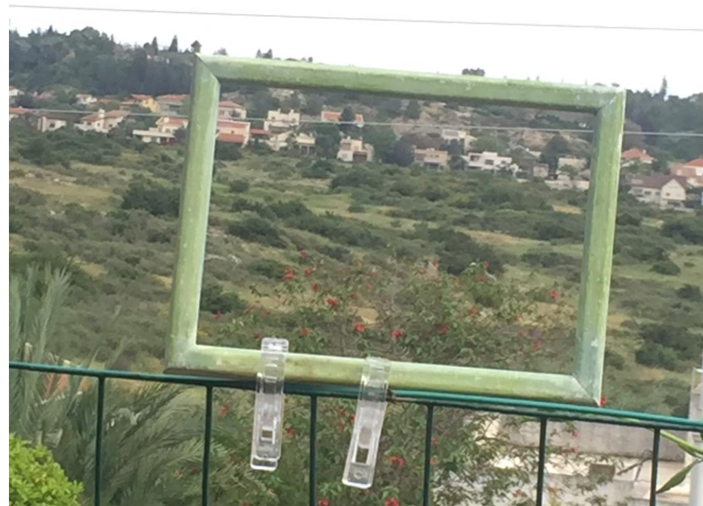
גוונים בנוף הרחוק