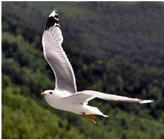
תמונה זו מאת מחבר לא ידוע ניתן ברשיון CC BY-SA במסגרת