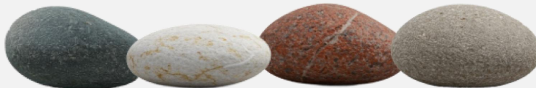
מפגשים בחברה הישראלית

מילים מהלב בספרדית מכתבי תמיכה למשפחות חטופים ומשוחררים