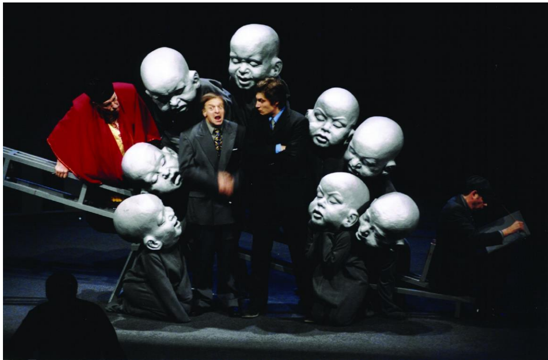
Oedipus rex / DIRECTOR Oskaras Koršunovas

עליו לנסח בקיצור את העלילה, את המסר ו/או המטרה שהמיתוס משרת, ומהו אופן גלגולו של המיתוס (בעל-פה? בארוחת ליל הסדר? בסרטים? בתעמולה פוליטית? וכו').