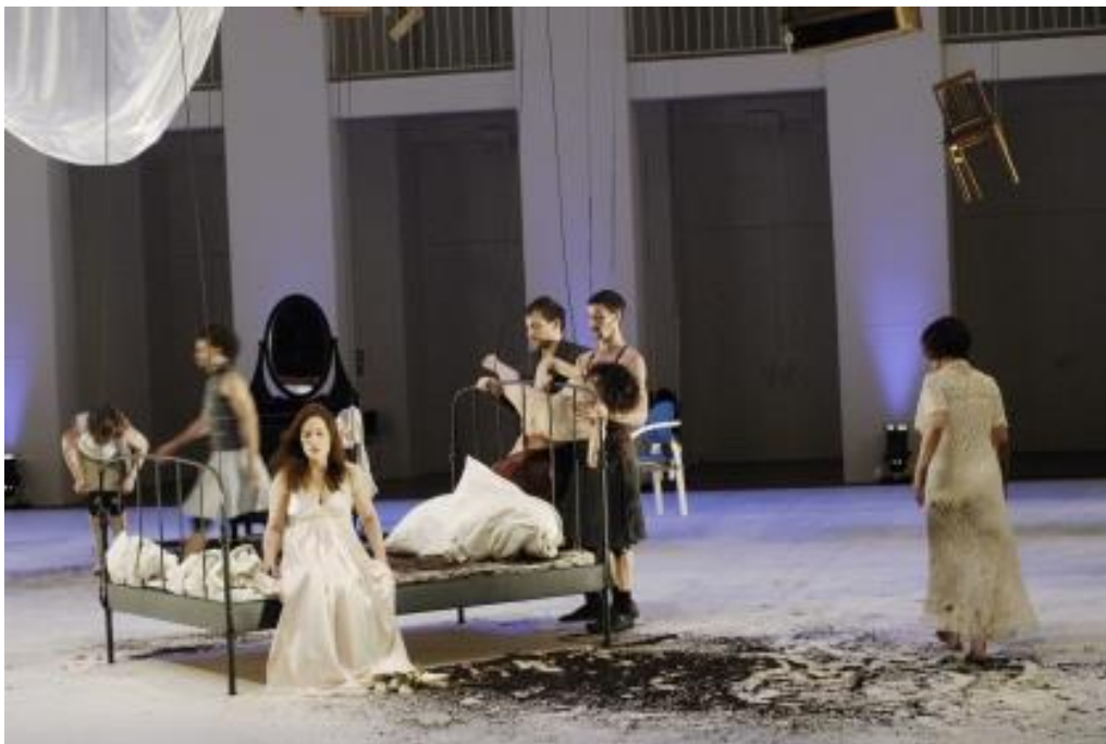
Oedipus Rex / Director: Constanza Macras / Stage design: Chiharu Shiota

יש להשאיר בציר הזמן מקום לארועי הסצנה האחרונה של המחזה.