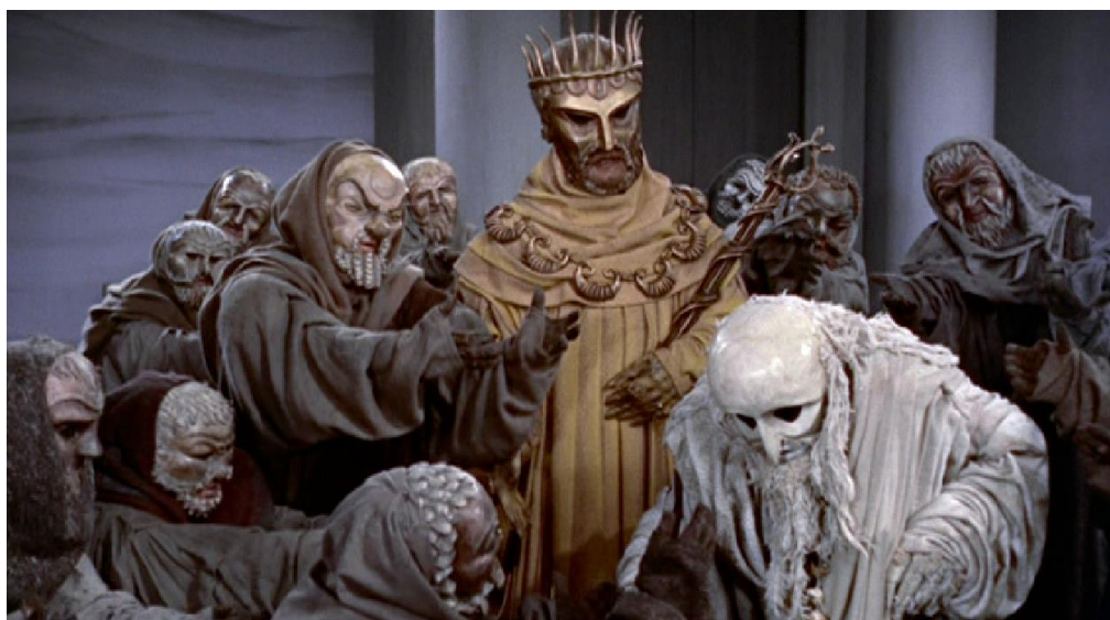
Oedipus Rex (film) / Director: Tyrone Guthrie