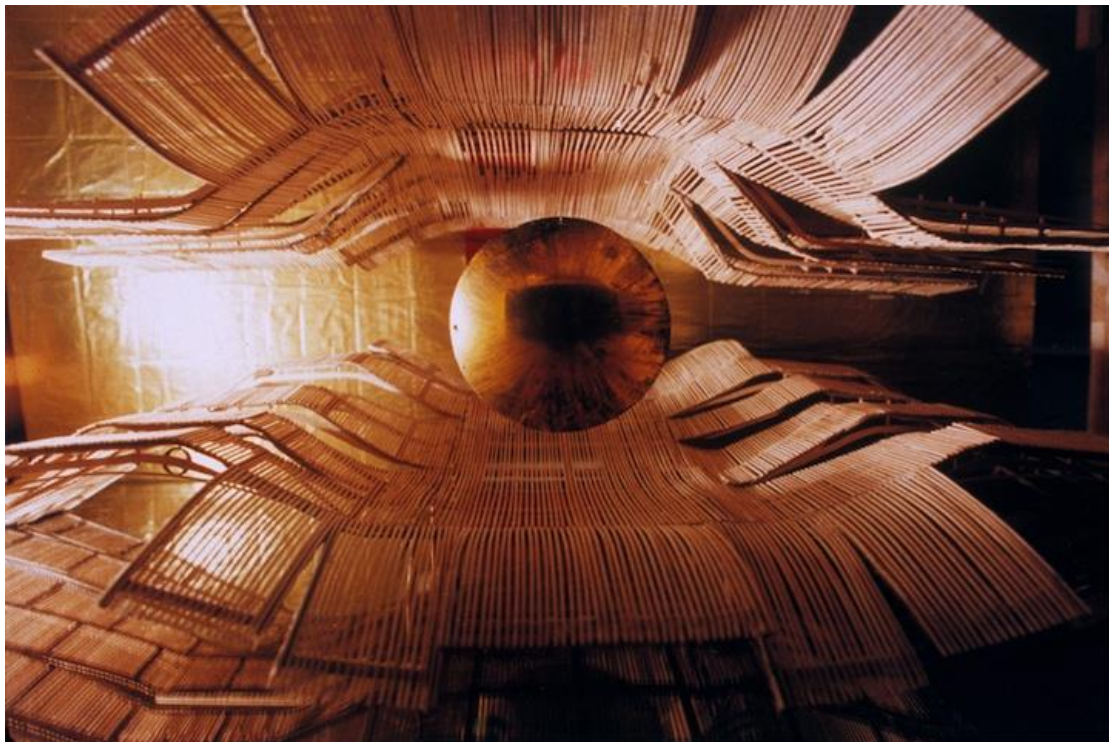
Oedipus Rex / Director: Julie Taymore / Stage design: George Tsypin

למידת עמיתים + עבודה קבוצתית לקראת מטרה: עבודה בקבוצות בנושא "אדיפוס בשתי דקות" - התלמידים מתבקשים לתמצת את המחזה ליצירה קצרצרה, שבה ניתן לתמצת כל סצנה למשפט-שניים מרכזיים שחושפים את ארועי העלילה (כולל שירי המקהלה). ניתן להציג בכל דרך יצירתית אפשרית: קומיקס, סרטון, קולאז' מוסיקלי, פסלים בפריז, פנטומימה, תיאטרון בובות וחפצים וכו'. את היצירה יש לתעד ולהעלות לפייסבוק הקבוצתי.