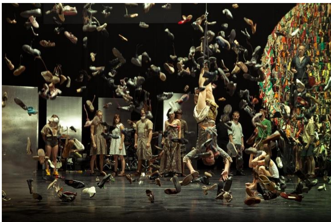
Oedipus Rex / Director: Wim Vandekeybus

על כל תלמיד לאתר 2 ציטוטים מן המחזה הממחישים כל אחת מהתכונות של הגיבור הטראגי עפ"י אריסטו, ולסכם בקצרה מדוע הציטוטים מדגימים, לדעתו, את תכונת הדמות.