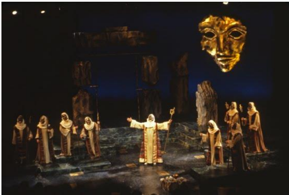
Oedipus Rex / Director: Jarka Burian

ש"ב: התלמידים מתבקשים לחקור ולהכין מצגת סיכום + תמונות של אחד מהמושגים הבאים עבור שאר הכיתה: תיאטרון יווני, סקנה, אורקסטרה, אקיקלמה, דאוס אקס מאכינה, מסכות בתיאטרון היווני, תלבושות בתיאטרון היווני.