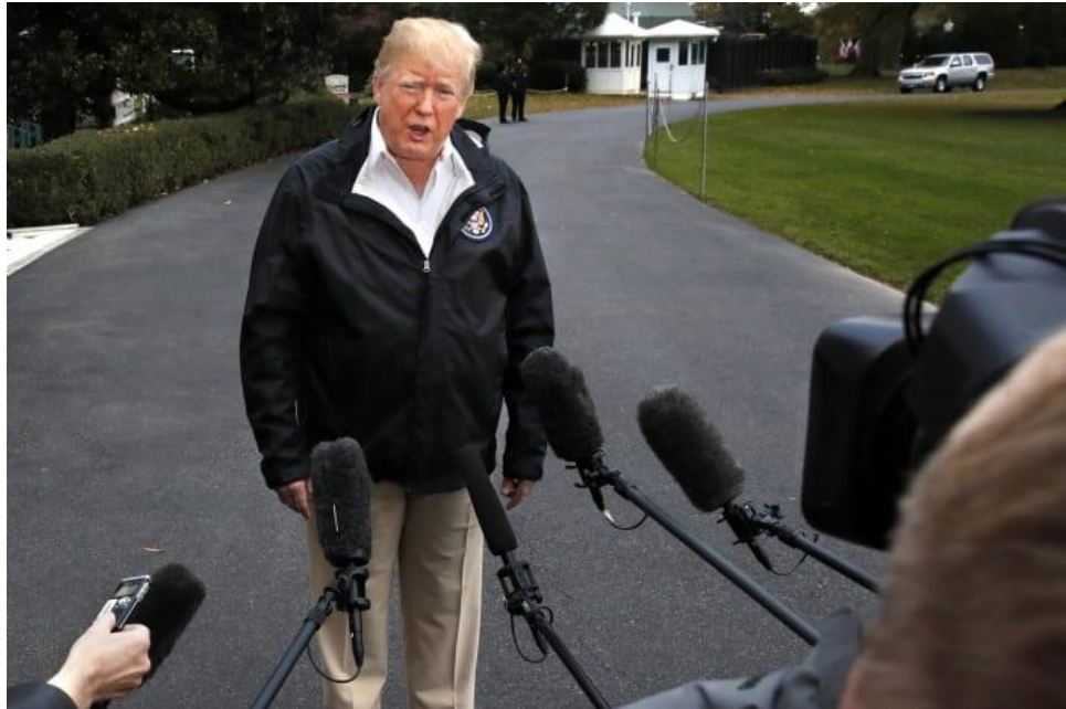
בני אדם הם אחראיים על התחממות כדור הארץ. טראמפ לפני כשבוע

למרות שהשלכות שינויי האקלים - בהן סערות עוצמתיות תכופות - מורגשות ברחבי העולם כבר בימים אלה, מחברי הדוח טוענים כי ניתן לשנות את תחזיות הנזק אם היקף פליטת גזי החממה יצומצם באופן משמעותי. "הסיכונים העתידיים של שינוי האקלים תלויים בעיקר בהחלטות שמתקבלות היום", צוין בדוח.