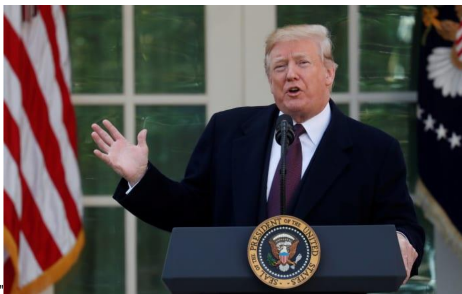
לא מאמין לזה". הנשיא טראמפ במהלך הצהרה בבית הלבן בשבוע שעבר

בסוף השבוע בו פורסם הדוח ציינו בארצות הברית את חג ההודיה, מה שהעלה תהיות בנוגע לעיתוי ולניסיונות לווודא שלא יזכה לתהודה תקשורתית . טראמפ מצדו, לא התרגש מהממצאים. "כרגע יש לנו (את האוויר והמים) הכי נקיים שראיתי, וזה חשוב לי מאוד", אמר. "אבל אם אנחנו נקיים ושאר העולם מלוכלך, זה לא טוב. אני רוצה מים ואוויר נקיים, זה חשוב מאוד."