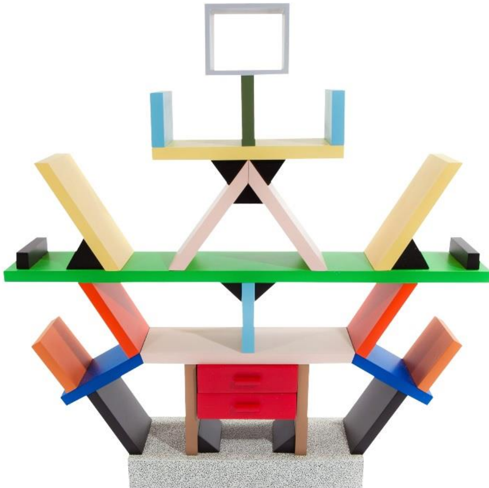
.Carlton bookcase, designer: Ettore Sottsass, year: 1981, courtesy: Memphis srl

ארון "קרלטון", 1981, אטורה סוטסאס, קבוצת ממפיס איטליה