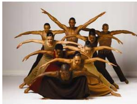
מתוך החלק הראשון של הריקוד "התגלויות"- 1960

מייד עם הקמת הלהקה (ב-1958) יצר איילי ללהקתו את הכוריאוגרפיה הראשונה שלו- "סוויטת בלוז", שהושפעה מדמויות ומקומות מילדותו בטקסס, כשהיא מלווה במוזיקת בלוז מסורתית. ב-1960, העלה את יצירת המאסטר שלו "התגלויות"- "Revelations" שהפכה לסימן ההיכר של הלהקה ומועלית מאז ועד היום בכל מופע של הלהקה. מאז שנוצרה לפני 50 שנה (!) היא נצפתה בעולם, ע"י מיליוני צופים ויש הסכמה גורפת בעולם על ייחודיותה והיותה יצירת מופת. מעבר להיותה יצירה מוזיקלית וביצועית מעולה, המסר האנושי האוניברסלי של "התגלויות" ברור ומובן בקלות ע"י קהל בכל העולם והוא המפתח להצלחתה. הכוח של קבוצה אנושית שמחוברת ברבדים פיזיים, רגשיים ותרבותיים הוא כה חזק, שעד היום היא אינה נתפסת כיצירה מיושנת והיא נחשבת ל"על-זמנית".