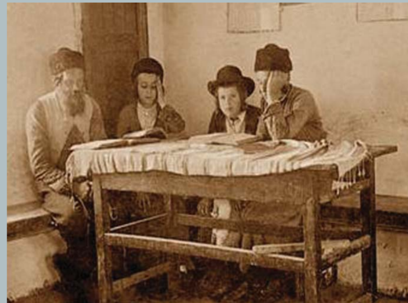
תלמוד תורה במירון, 1912.

בית שמאי אומרים: אל ישנה [=לא ילמד] אדם אלא למי שהוא חכם ועניו ובן תורה, ובית הלל אומרים, לכל אדם ישנה [=ילמד] - כי הרבה פושעים היו בישראל, ובשביל שנתקרבו לתלמוד תורה יצאו מהם צדיקים וחסידים.