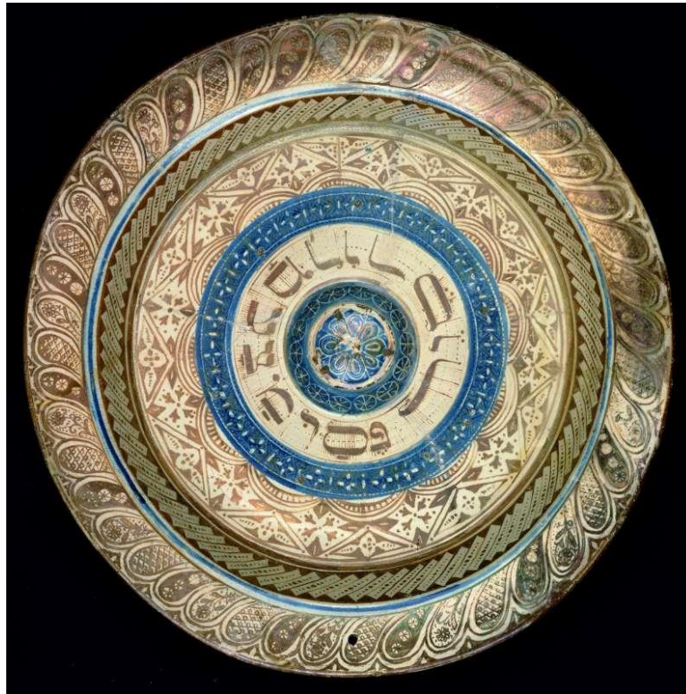
קערת הסדר של יהודי ספרד (מקור: מוזיאון ישראל, ירושלים)

מרכז המורים הארצי למדע וטכנולוגיה בחינוך היסודי