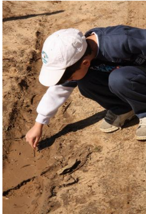
מפגש בלתי אמצעי עם הסביבה