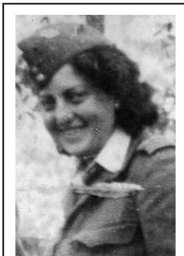
חנה סנש (1944–1921)

מעובד לפי אנציקלופדיית יבנה, כרך 11, 2005 ולפי אנציקלופדיית אביב חדש, כרך 13, 2004