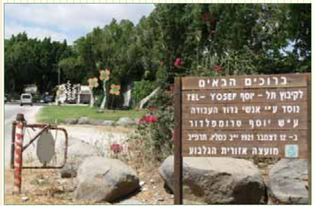
שער הכניסה לקיבוץ תל-יוסף