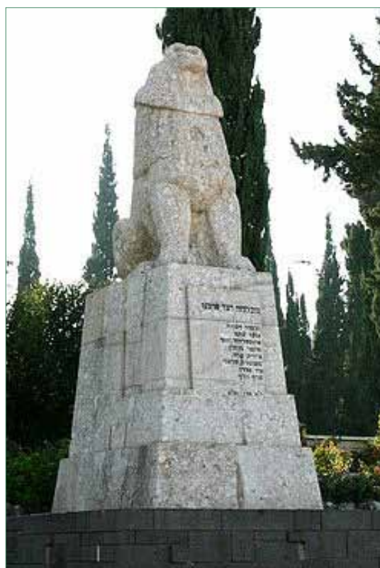
פסל "האריה השואג" בתל חי

בבוקר ה-1 במרץ 1920, י"א באדר תר"פ, התגודדו ערבים רבים מצפון לחצר תל חי ודרשו לבדוק אם אין צרפתים בחצר. מפקדם וכמה מאנשיו הורשו להיכנס ולראות כי אין מסתירים איש, אלא שבמהלך החיפוש פרץ קרב. המגנים שנערכו למתקפה מבחוץ, מצאו עצמם מותקפים גם מבית, רבים נפגעו וביניהם גם יוסף טרומפלדור. במאורעות נהרגו חמישה ונפצעו שישה מתוך שלושים מגני תל חי. הנותרים בחיים פינו את הנפגעים, אספו את הבהמות, את הציוד ואת המזון שנתרו והבעירו את החצר. ב"ג באדר, מחשש להתקפה גדולה נוספת, ננטשו גם כפר גלעדי ומטולה.