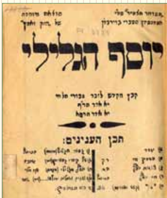
גיליון זיכרון של השומר הצעיר