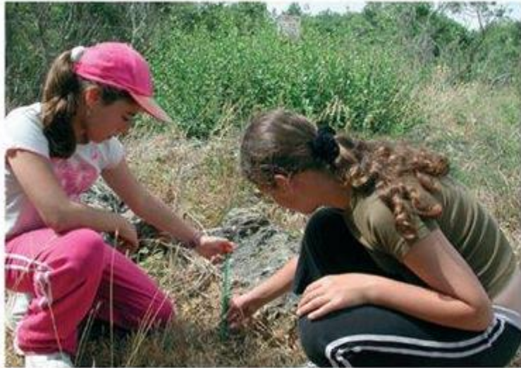
מידת טמפרטורת האדמה