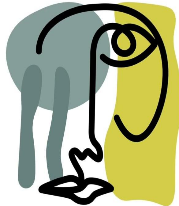
גידי גוב שיר תקווה