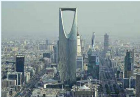
ריאד, ערב הסעודית

בשביל לקרר את הרחובות. השיטה מיושמת כבר באחת משכונות העיר. גם בישראל עולות הטמפרטורות בשנים האחרונות ונקווה ליישם את השיטה גם פה.