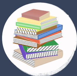
כשירות לשון תקשורתיות