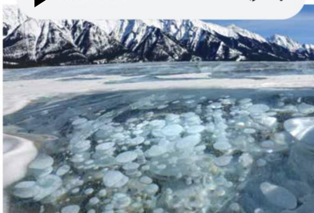
אגם אברהם, קנדה

✓ 'אגם אברהם' הוא אגם מלאכותי (נוצר בידי בני-אדם) הנמצא למרגלות 'הרי הרוקי' בקנדה. מיליוני מבקרים מגיעים בכל שנה לאגם כדי לחזות (לראות) בתופעת טבע נדירה: בועות קפואות בתוך המים. את הבועות יוצרים צמחים הצומחים על קרקעית האגם ופולטים גז 'מתאן'. בין החודשים נובמבר-מרץ מי האגם קופאים והגז הנפלט (יוצא מהצמחים נותר לכוד (תקוע) במי הקרח ויוצר בועות במגוון צורות. כאשר מגיע האביב ומי האגם מפשירים הבועות מתפוצצות במים.