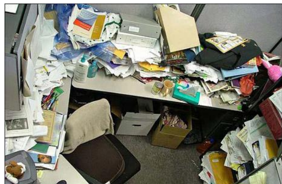
שולחן מבולגן (אתר כלכליסט)