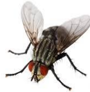
כנפיים קטנות וגוף חלש