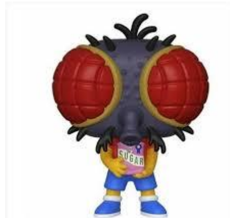
העיניים תופסות מקום ניכר בפנים