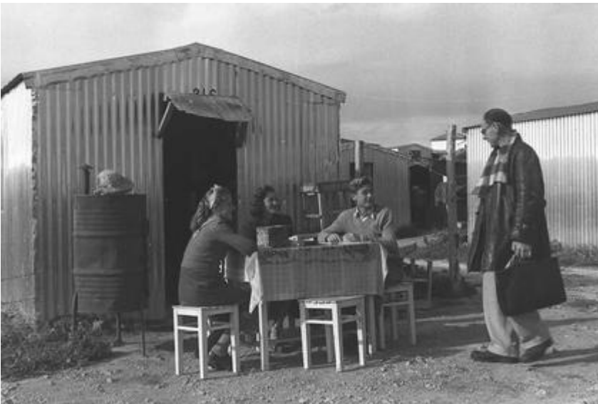
מעברה ליד נהריה, 1952

איתי נגרי, המחאה המזרחית בוואדי סאליב: האירועים והשפעתם עד לפנתרים השחורים , רסלינג, 2018.