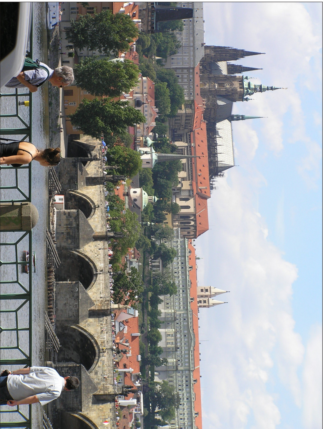
(מתוך אתר Wikimedia Commons, עלם לא ידוע)