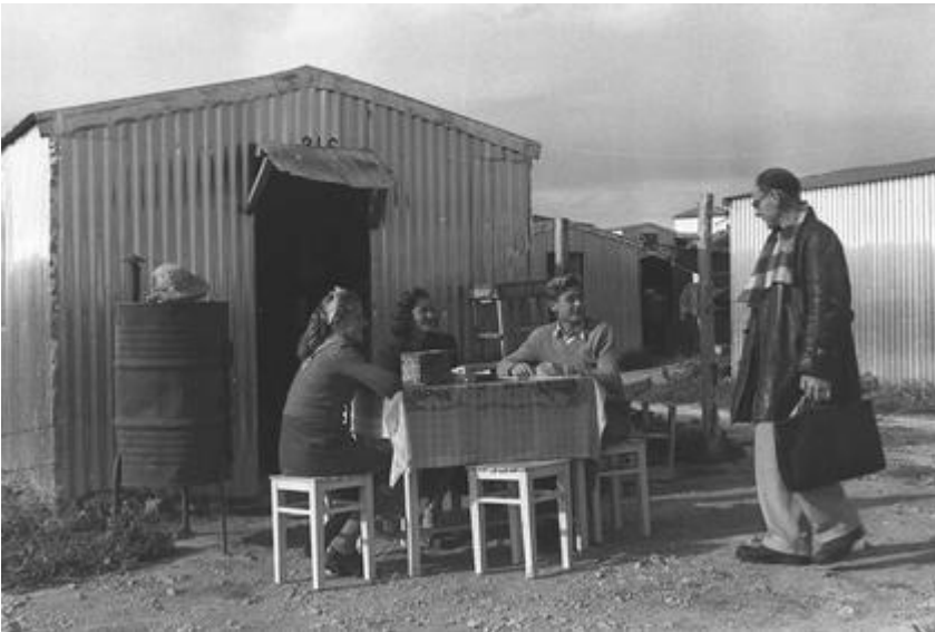
מעברה ליד נהריה, 1952