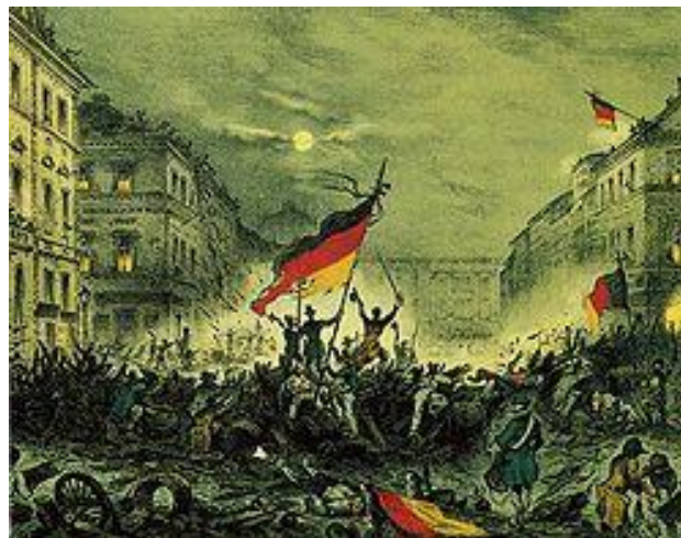
'אביב העמים' בברלין, גרמניה