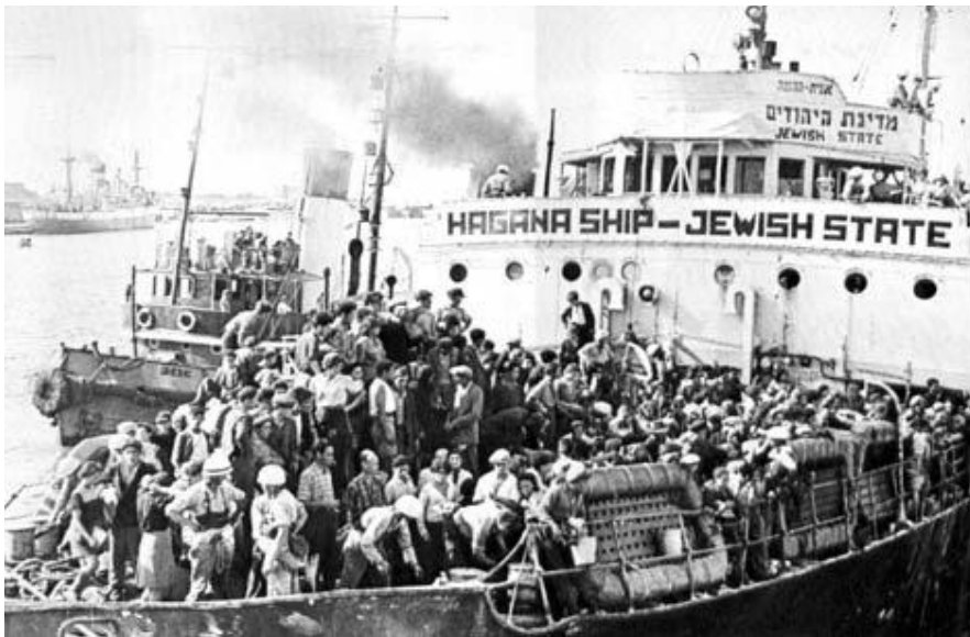
אונית המעפילים 'מדינת היהודים'

http://www.edu-negev.gov.il/tapuz/osnat2tp/medina/haapala1.htm