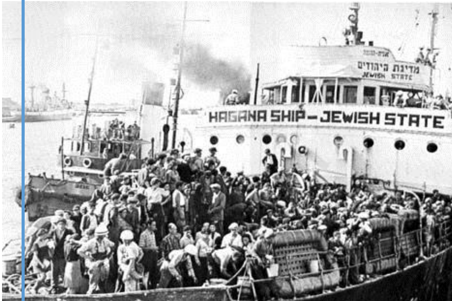
אונית המעפילים 'מדינת היהודים'

http://www.edu-negev.gov.il/tapuz/osnat2tp/medina/haapala1.htm