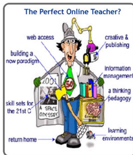
מתוך ה"מידע בידיים שלך", עלון גף יישומי מחשב, מנהל מדע וטכנולוגיה