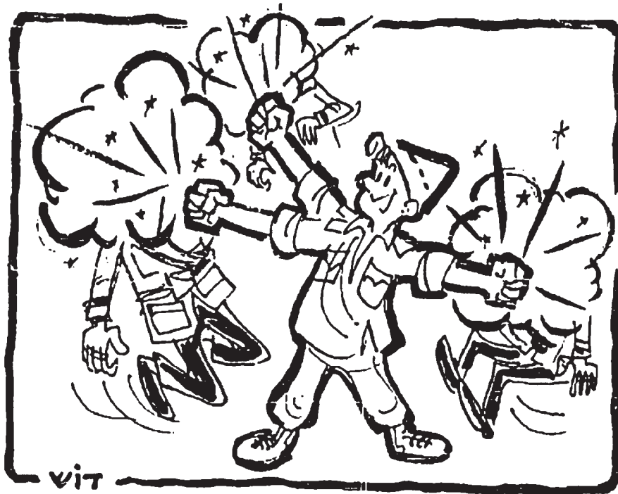
(מעריב, 7 ביוני 1967)