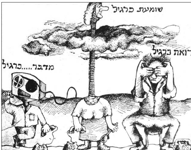
שר הבטחון משה דיין

א. לפניכם קריקטורה של א' ברקוביץ' שפורסמה בדצמבר 1973 בעיתון "העולם הזה".