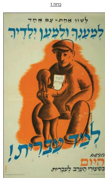
(מתוך אתר האינטרנט של הספרייה הלאומית)

2. שאלה מתוך בחינת בגרות שאלון 022281, קיץ תשע"ט: שני סעיפי השאלה מבטאים חשיבה מסדר גבוה: בסעיף הראשון נדרש התלמיד ליכולת הבחנה בין עמדה לעובדה בנייתוח מקור