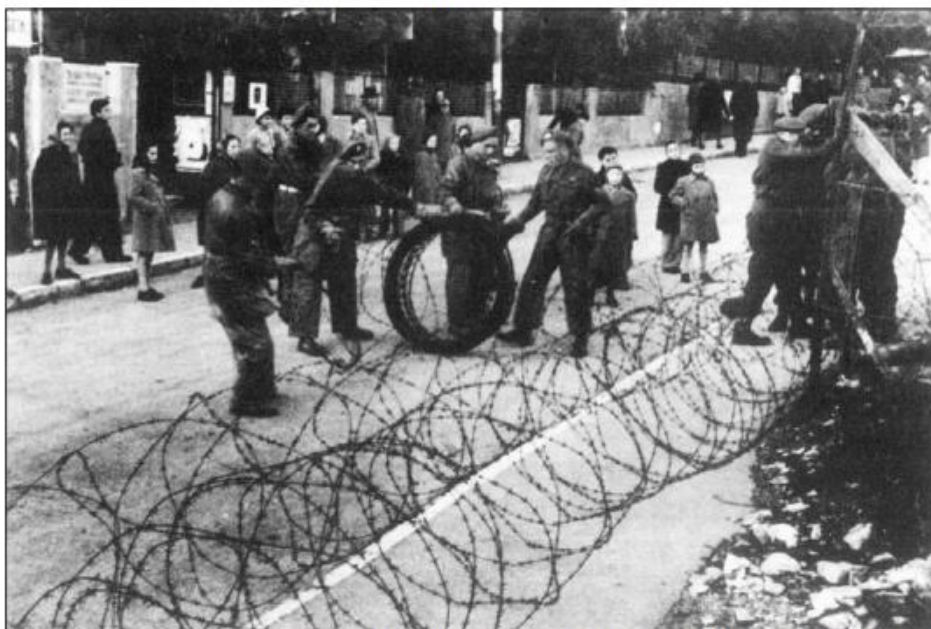
תצלום 1 – ירושלים (סוף תקופת המנדט הבריטי)

את סוג המאבק במופיע בכל תמונה ולאחר מכן לקשור בינה ובין החלטת בריטניה להעביר את שאלת א"י לאו"ם. משמע נשרש מהתלמיד לנתח טקסט חזותי וליישם את הידע שלמד.