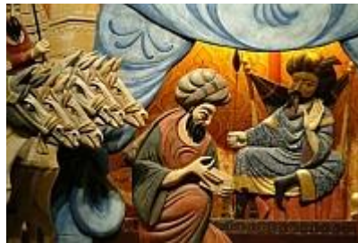
צלאח אל-דין מחוץ לחומות ירושלים