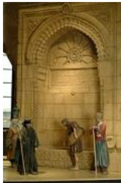
דמויות מייצגות בירושלים במאה ה-19

- התקופה העותמנית סקירת 400 שנות השלטון העות'מאני בירושלים (1517-1917), שבהן ידעה העיר ימים של פריחה ושל שפל. בהם ימי שלטונו של הסולטאן סולימאן המפואר, עת נבנו חומותיה ומרבית שעריה של העיר. במרבית התקופת העותמנית הייתה ירושלים כפר נידח בפאתי האימפריה העות'מאנית אך מצב זה השתנה במאה ה-19, כשחדרו המעצמות האירופיות לירושלים בעקבותיהן נכנסה העיר אל העידן המודרני.