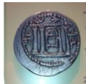
מטבע כסף ועליו הכתובת "ירושלים"

- התקופה הביזנטית - תצוגה ובה ניתן ללמוד על השינוי שחל במעמדה של העיר ירושלים עם הפיכת הנצרות לדת הרשמית של האימפריה הרומית (המאה ה-4 לספירה). בעקבות כך משכה אליה העיר צליינים מקרוב ומרחוק. בתצוגה משולב דגם של כנסיית הקבר, ייחודי מסוגו בעולם, המציג מראה מלא ומפורט של הכנסייה במאה ה-4 לספירה.