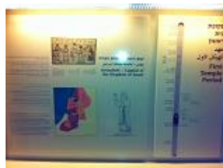
מצור צבא סנחריב על ירושלים