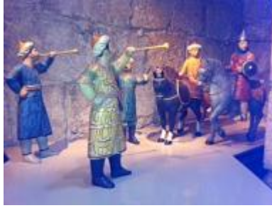
ממלכים ברחובות ירושלים

- התקופה העותמנית סקירת 400 שנות השלטון העות'מאני בירושלים (1517-1917), שבהן ידעה העיר ימים של פריחה ושל שפל. בהם ימי שלטונו של הסולטאן סולימאן המפואר, עת נבנו חומותיה ומרבית שעריה של העיר. במרבית התקופת העותמנית הייתה ירושלים כפר נידח בפאתי האימפריה העות'מאנית אך מצב זה השתנה במאה ה-19, כשחדרו המעצמות האירופיות לירושלים בעקבותיהן נכנסה העיר אל העידן המודרני.