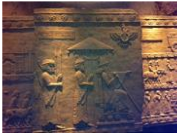
תבליט המציין את הצהרת כורש