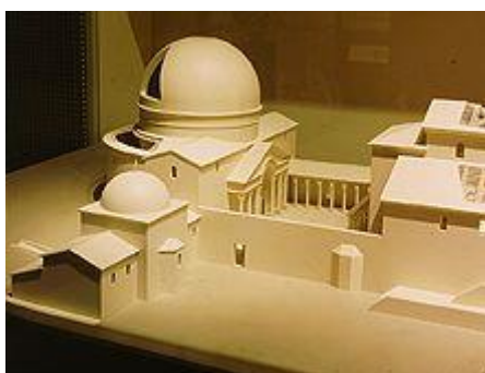
דגם כנסיית הקבר

- התקופה הביזנטית - תצוגה ובה ניתן ללמוד על השינוי שחל במעמדה של העיר ירושלים עם הפיכת הנצרות לדת הרשמית של האימפריה הרומית (המאה ה-4 לספירה). בעקבות כך משכה אליה העיר צליינים מקרוב ומרחוק. בתצוגה משולב דגם של כנסיית הקבר, ייחודי מסוגו בעולם, המציג מראה מלא ומפורט של הכנסייה במאה ה-4 לספירה.