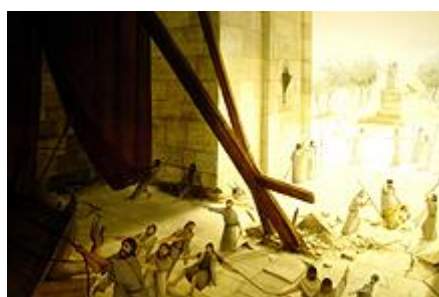
טיהור בית המקדש