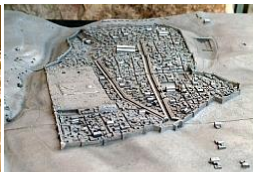
דגם ירושלים הביזנטית

- התקופה המוסלמית התצוגה מספרת את סיפורם של למעלה מארבע מאות שנות כיבוש מוסלמי בירושלים שתחילתו בשנת 638 לספירה כשכנעה ירושלים בפני הכובשים המוסלמיים, והייתה למרכז הדתי השלישי בחשיבותו לאיסלאם. בתצוגה משולב דגם ייחודי המתאר את מבנה כיפת הסלע כפי שנראה סמוך לבנייתו (מאה 7 לספירה).