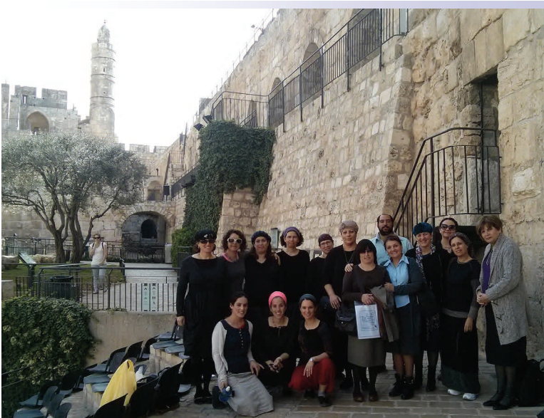
צוות המדריכים ביום לימוד וסיור במוזיאון מגדל דוד

בלימוד נושא המהפכה הצרפתית פתחנו את השיעור בצפייה במצגת על המהפכה בזוגות, כאשר כל זוג תלמידות נתבקשו לשאול בווטס אפ (בקבוצת היסטוריה שפתחנו) שאלה אחת שמתעוררת בעקבות קריאת המצגת. שאלה על משהו לא מובן, שאלה שמתעוררת בעקבות הקריאה, משהו שהיו רוצות לדעת ולא רשום וכיוב'. הפכנו את כל השאלות להיגדים וכל זוג רשם את ההיגד שלו על הלוח. התקבלו מגוון נקודות התייחסות שעליהן למדנו בשיעורים הבאים. בהמשך המהלך התלמידות קיבלו קישורים שונים בטאבלטים, ויחד עם מחוון מסודר עברו תהליך של למידה מעמיקה.