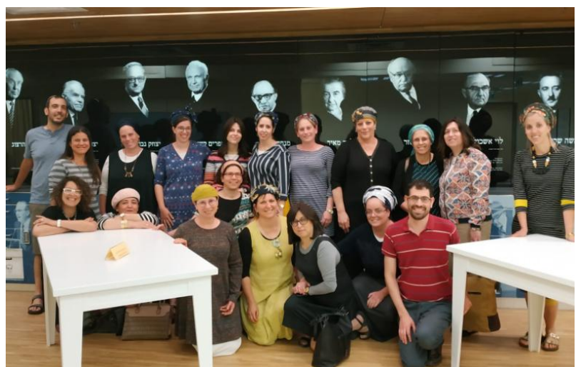
המפמ"ר וצוות וההדרכה של היסטוריה חמ"ד בביקור בארכיון המדינה

הארכיון ליותר ויותר נגיש לכלל הציבור. לצד עובדי המדינה וחוקרים מתעניינים בחומריו גם כאלו שמבקשים לעיין בתיקים שונים ומגוונים הנוגעים להם מבחינה אישית, כולל חומר גנאלוגי. פרסומי הארכיון מוגשים אף הם בצורה דיגיטלית ופונים למגוון של קוראים, ובכלל זה תלמידי בתי הספר.