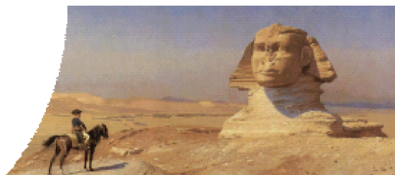
إضافات فنية مختلفة