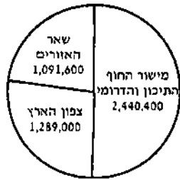
מספר התושבים בישראל בשנת 1990