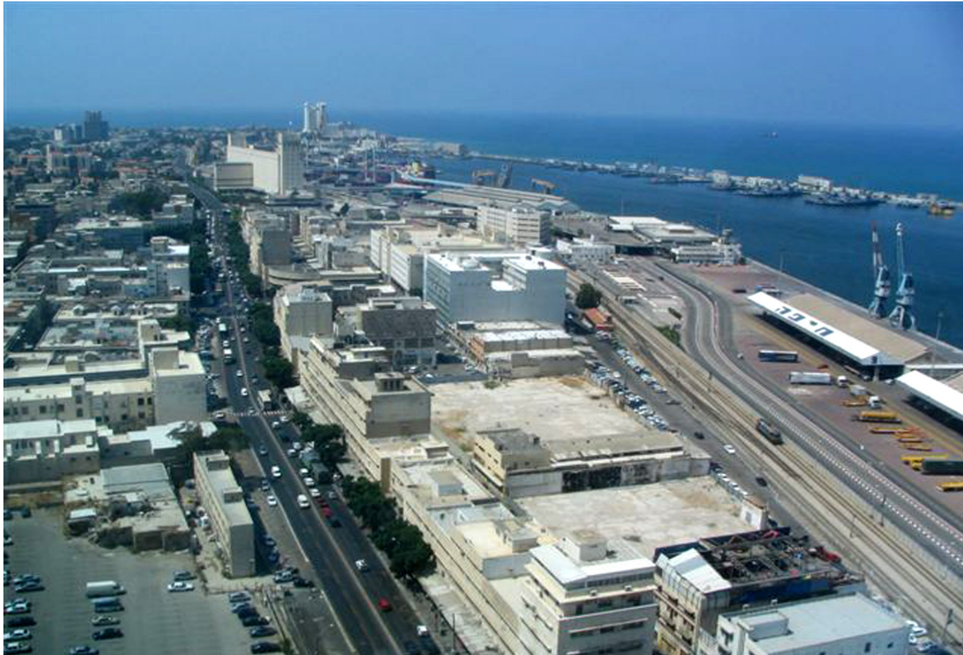
תמונה 1 الصورة ١