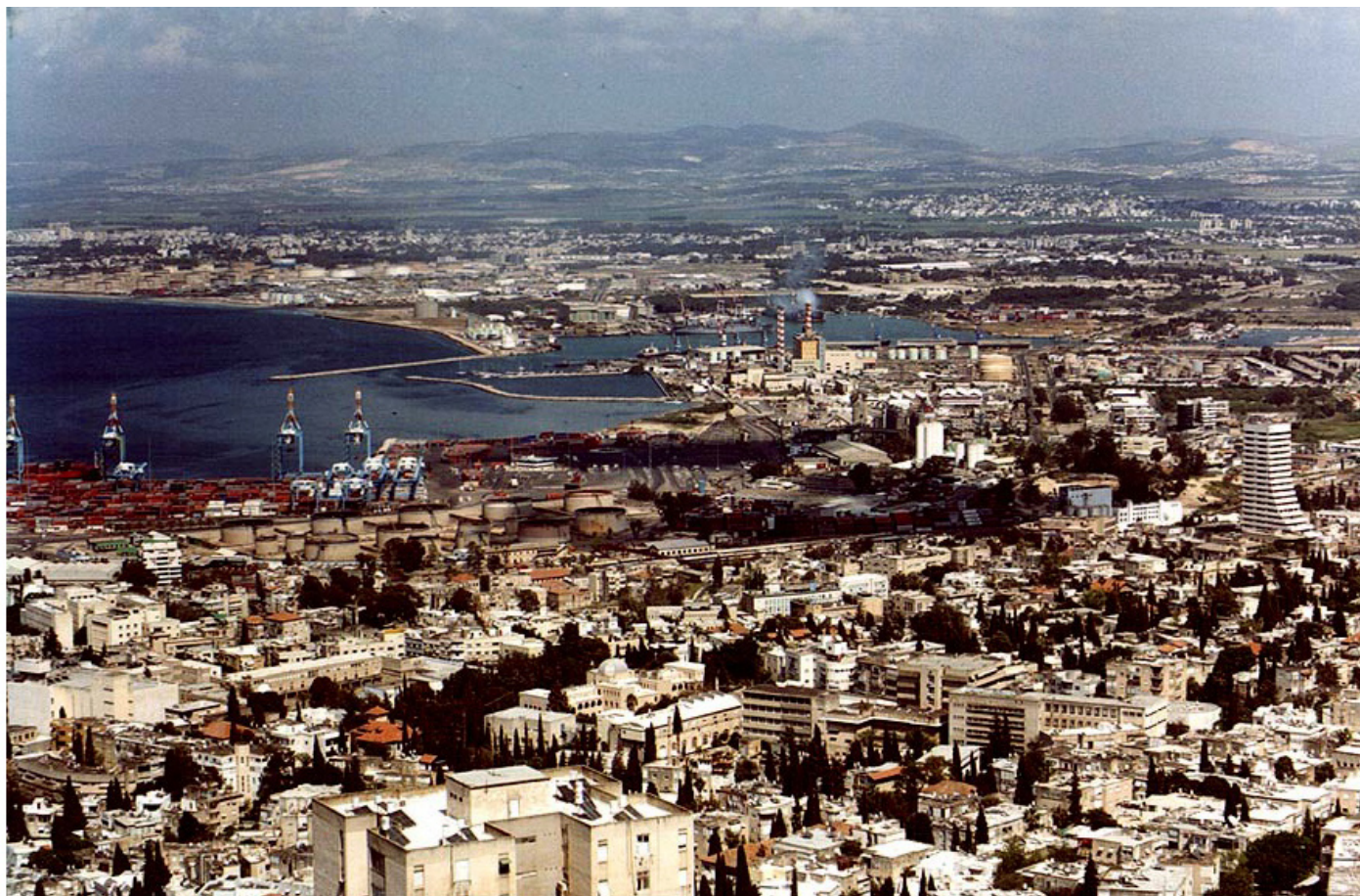
תמונה 2 الصورة 2

גאוגרפיה, חורף תשס"ז, מס' 573 الجغرافية، شتاء 2007/06، رقم 573