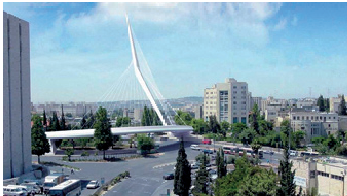
תמונה 3 "גשר המיתרים" - גשר הרכבת הקלה בכניסה לעיר