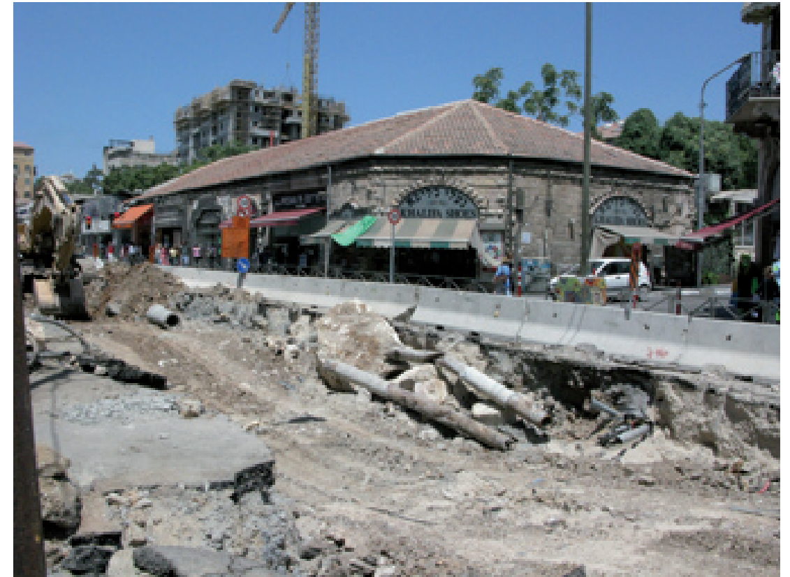
תמונה 1 - העבודות ברחוב יפו (מרכז העיר)