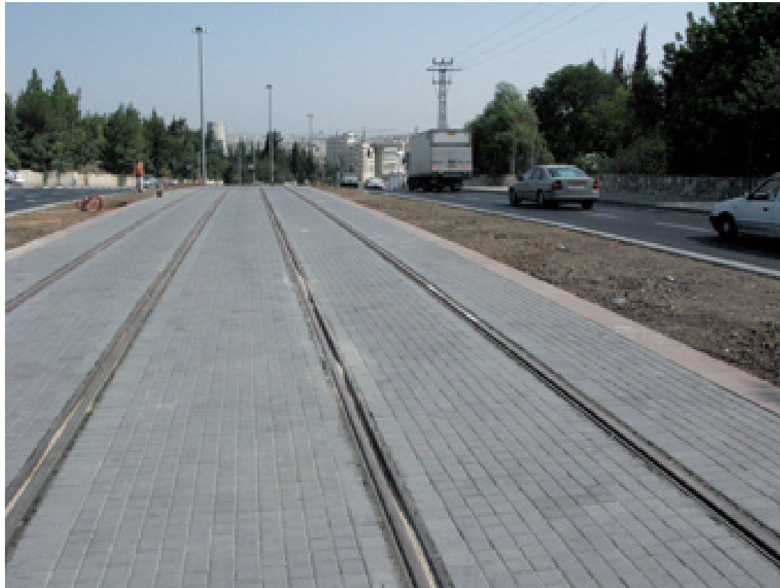
תמונה 2 - קטע גמור בשדרות הרצל