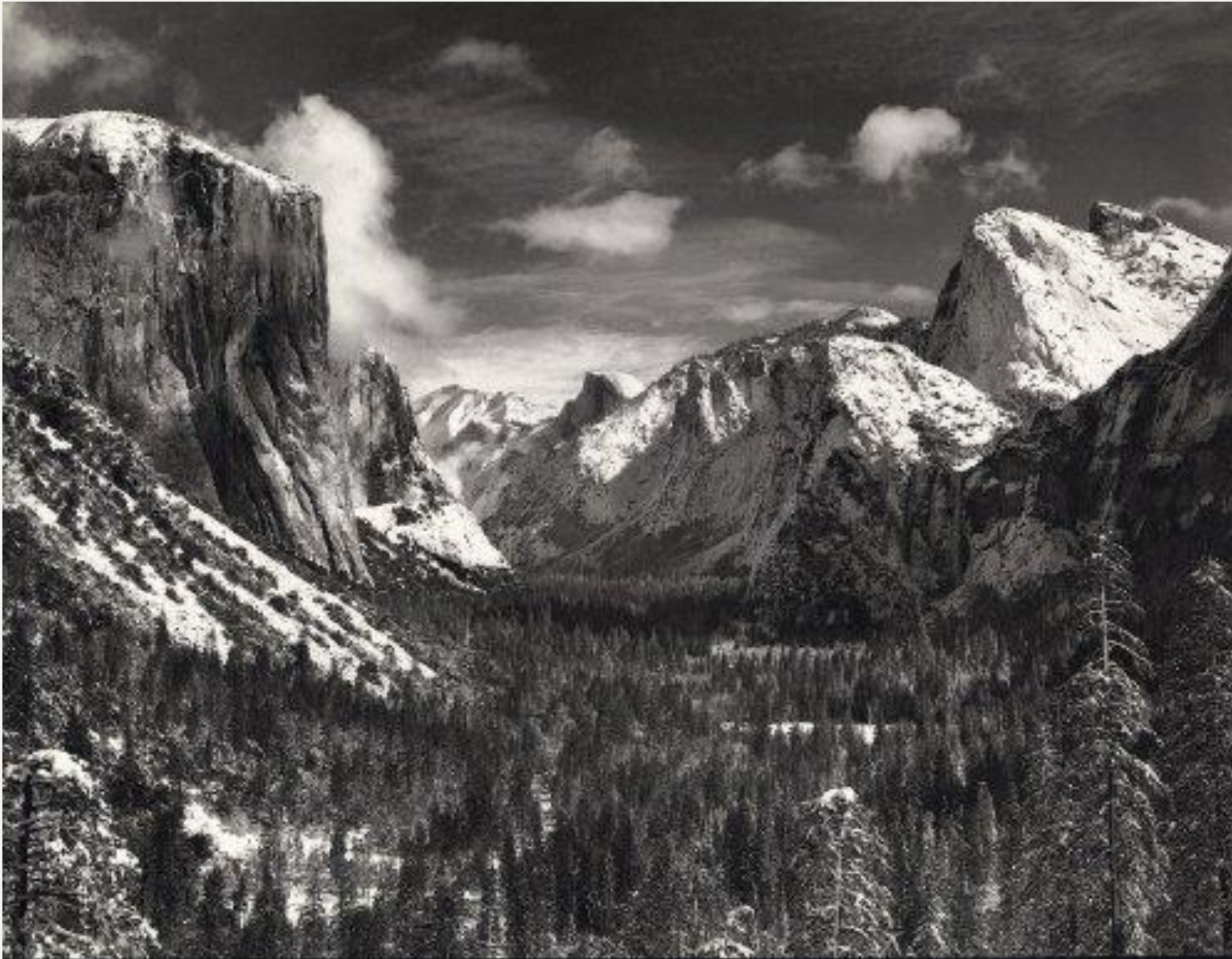
ANSEL ADAMS YOSEMITE AND THE HIGH SIERRA

هل تعتقدون أن صورة كهذه من الممكن أن تؤدي لتغيير اجتماعي؟؟