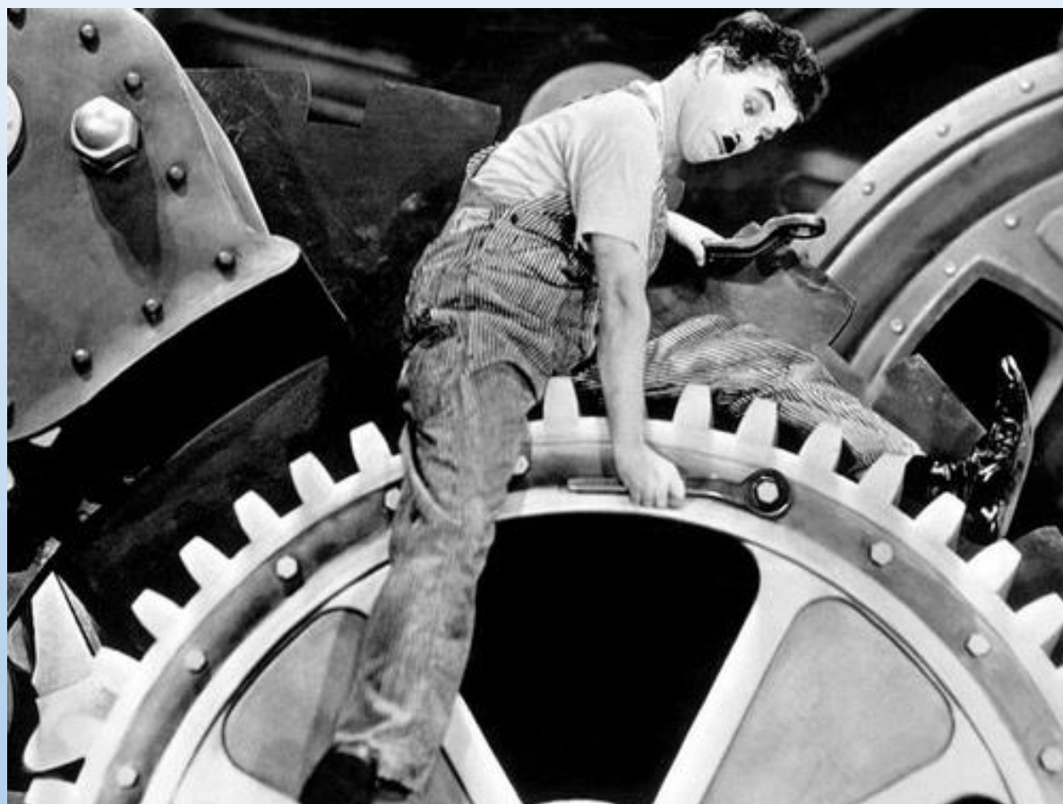
"זמנים מודרניים"/"ארה"ב (1936)