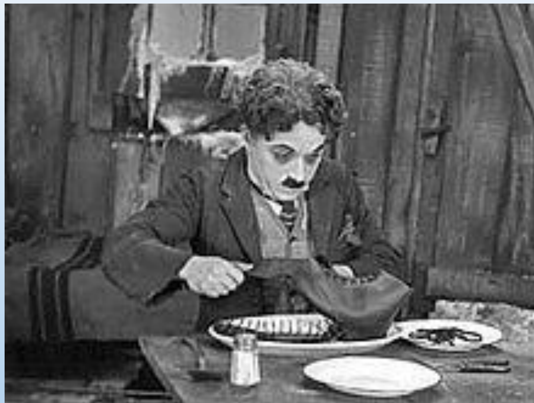
"הבהלה לזהב" / ארה"ב (1925)