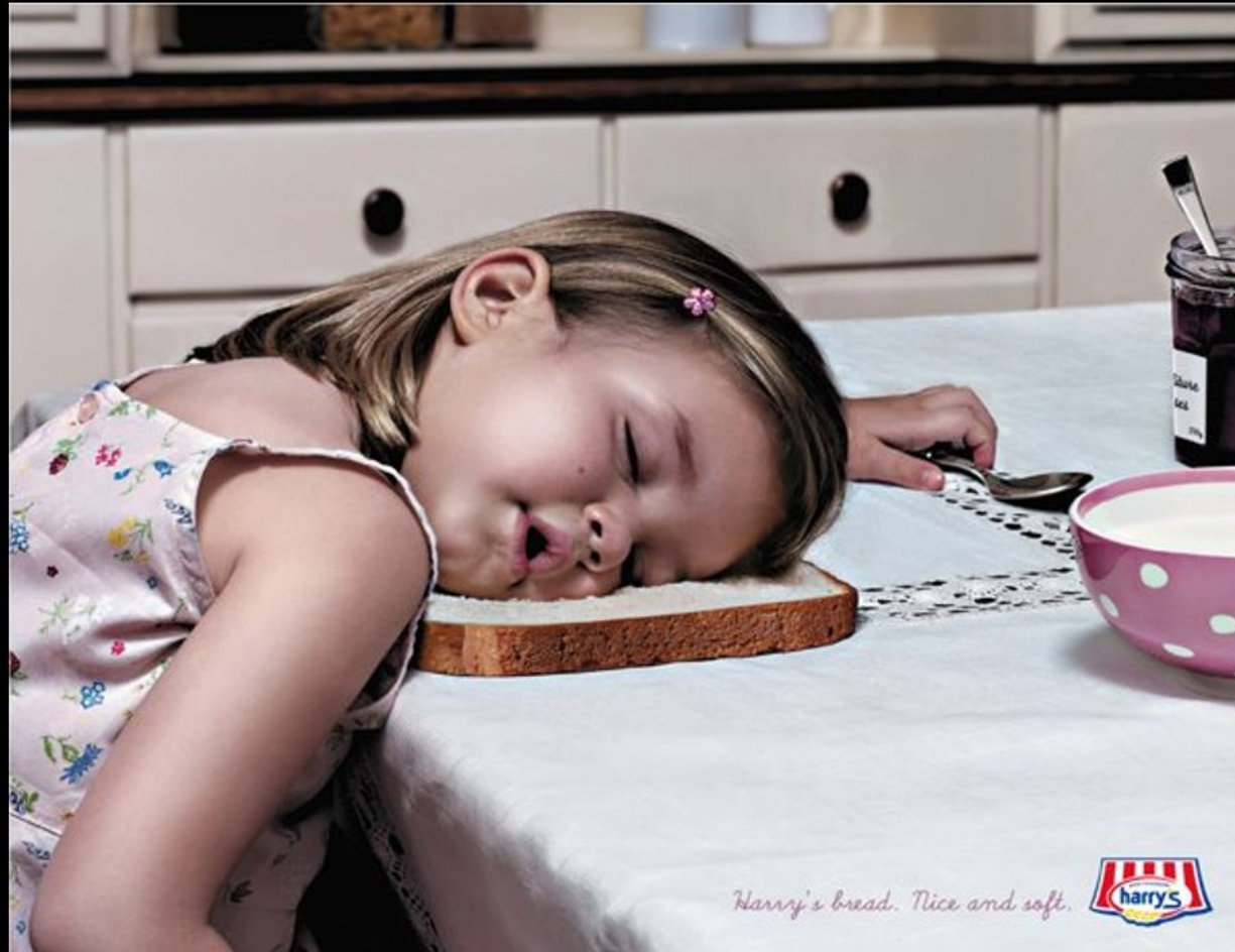
לחם נעים ורך