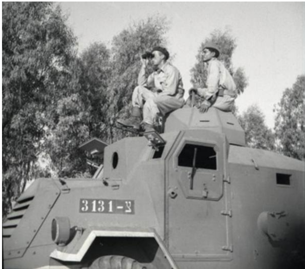
כיבוש שדה התעופה בלוד 1948