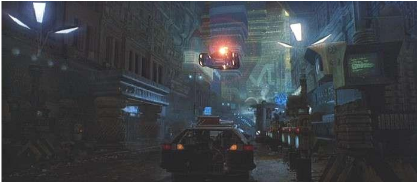
העיר האפלה בסרטו של רידלי סקוט בלייד ראנר