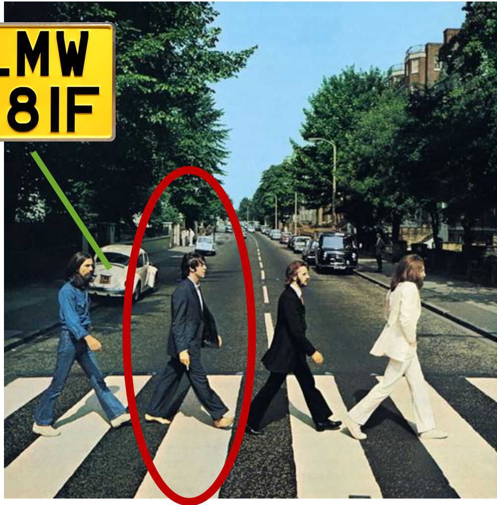
Abbey Road \ Beatles 1969