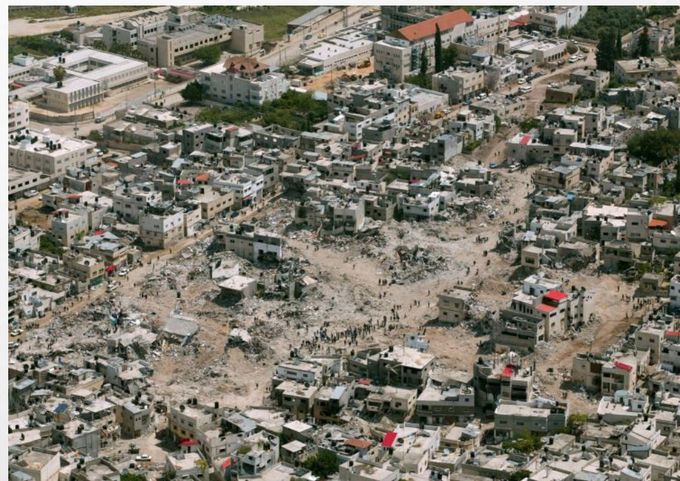
צילום אווירי של אזור הקרב בג'נין. במרכז התמונה שטחים בהם נהרסו בתים במהלך הקרב. ב- 13 באפריל 2002 .