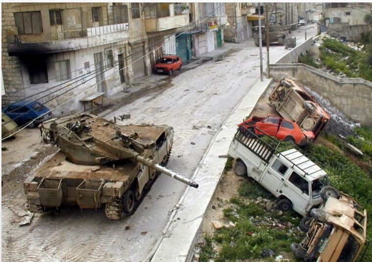
טנק ברחובות ג'נין במבצע חומת מגן