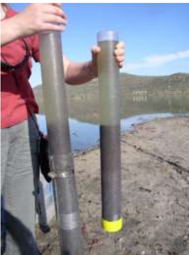
גלעין משקעים שנאסף מאגם.

4. לעלייה בכמות האצות יכולות להיות השפעות שונות על המערכת האקולוגית. על אילו גורמים ביוטים וא-ביוטים יכולה העלייה בכמות האצות להשפיע? הסבירו כיצד.