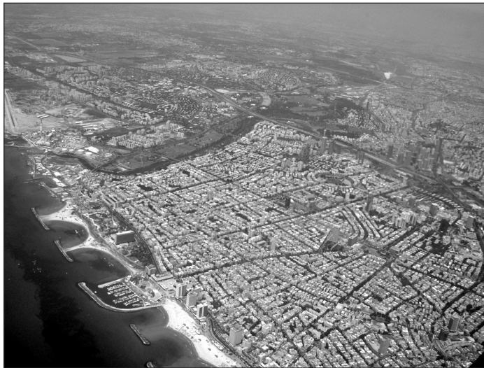
מתוך הערך "ישראל", ויקיפדיה

ב. (1) לפניך תצלום אוויר של אזור תל אביב.